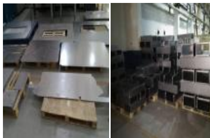
上图:贯彻 5S 精益生产之前