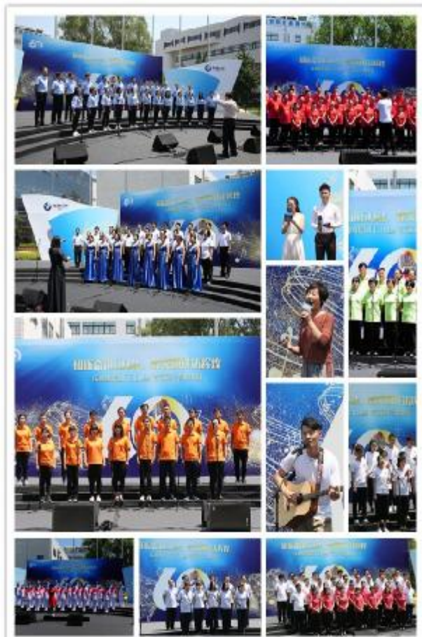
上图:部分比赛现场照片